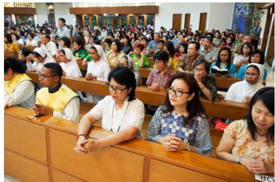
Umat Gereja St. Yohanes Bosco saat mengikuti Misa Minggu Februari 2018. Kapasitas tempat duduk di Gereja adalah 900 umat.

Jarak dari bangku ke tempat berlutut dibuat agak jauh daripada gereja lain umumnya, sehingga lebih nyaman (tidak sempit saat berdiri). Sehingga tidak menyulitkan umat untuk berjalan di sepanjang baris bangku, meski ada umat lain yang tetap duduk, misalnya saat Komuni.